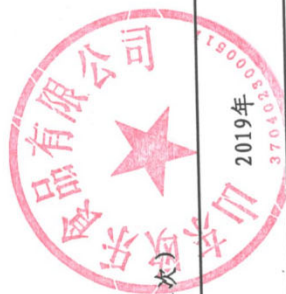
山城街道欧乐明细 (1次)